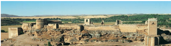
Castillo de Zorita de los Canes