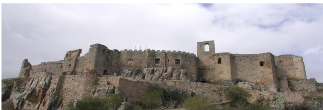
Sacro convento-castillo de Calatrava la Nueva