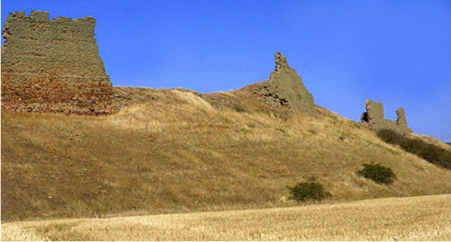
Castillo de Castrotorafe