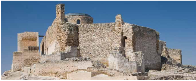
Calatrava la Vieja