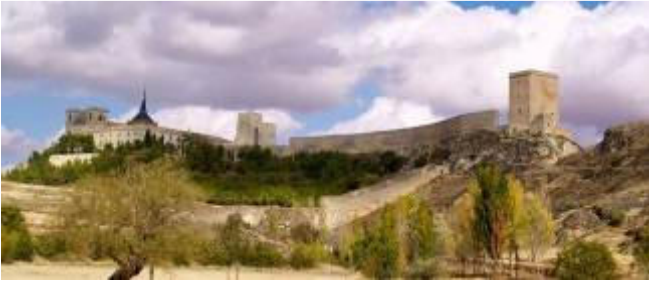
Convento-castillo de Uclés