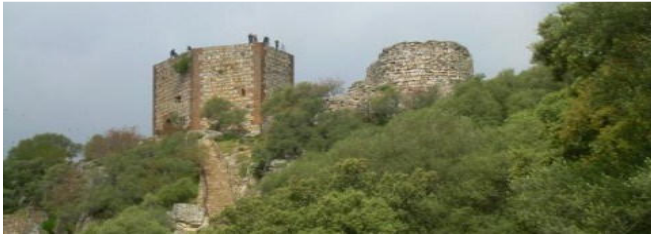
Castillo de Montfrag