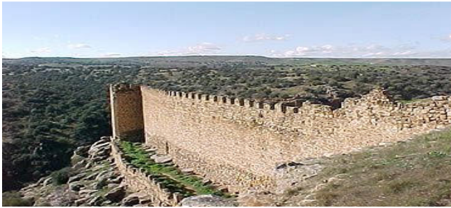
Castillo de Montalbán (Toledo) donde solo parte de los muros serían de la época templaria.