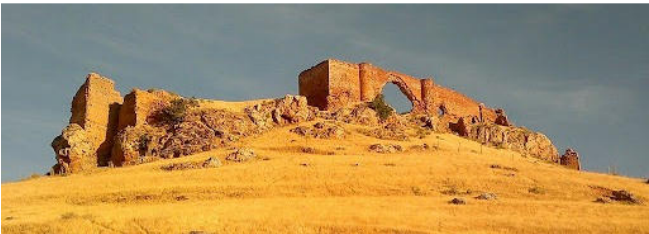
Castillo de Montiel