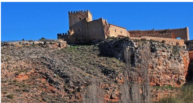
Castillo de Peñarroya