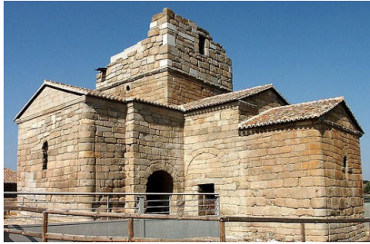
Stª Mª de Melque con resto de su torre defensiva.