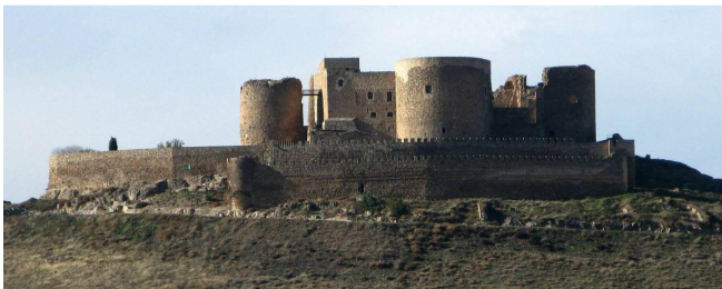
Castillo de Consuegra