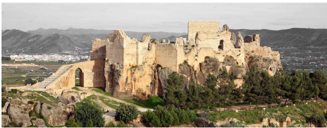
Convento-castillo de Montesa