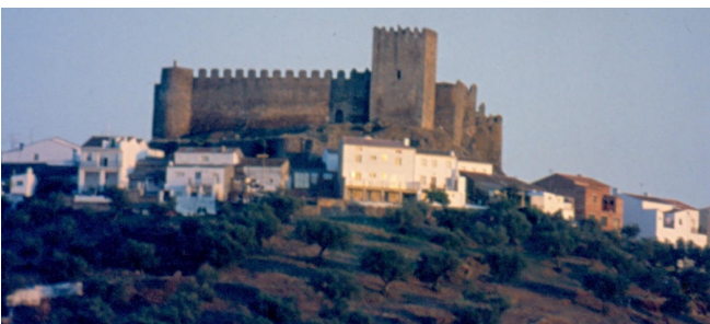
Segura de León