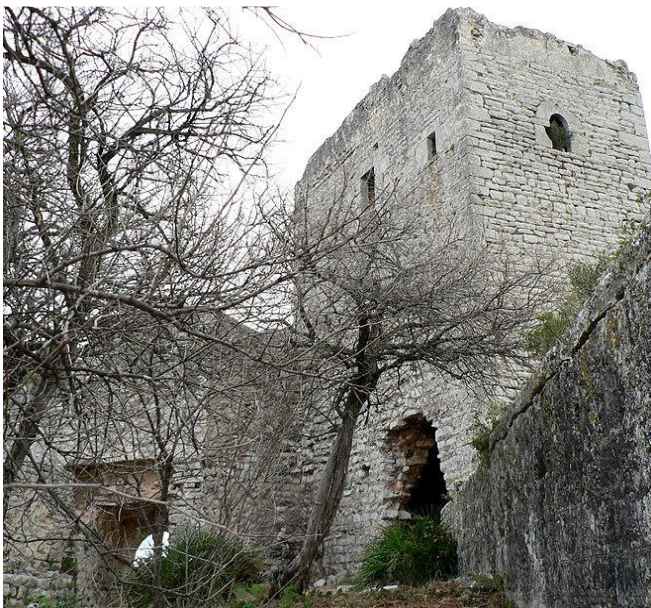
Castillo de Pulpis: Recinto tras la entrada