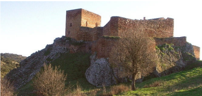
Castillo de Montizón