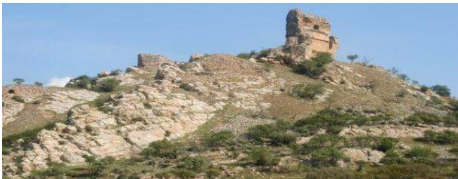
Castillo de Salvatierra